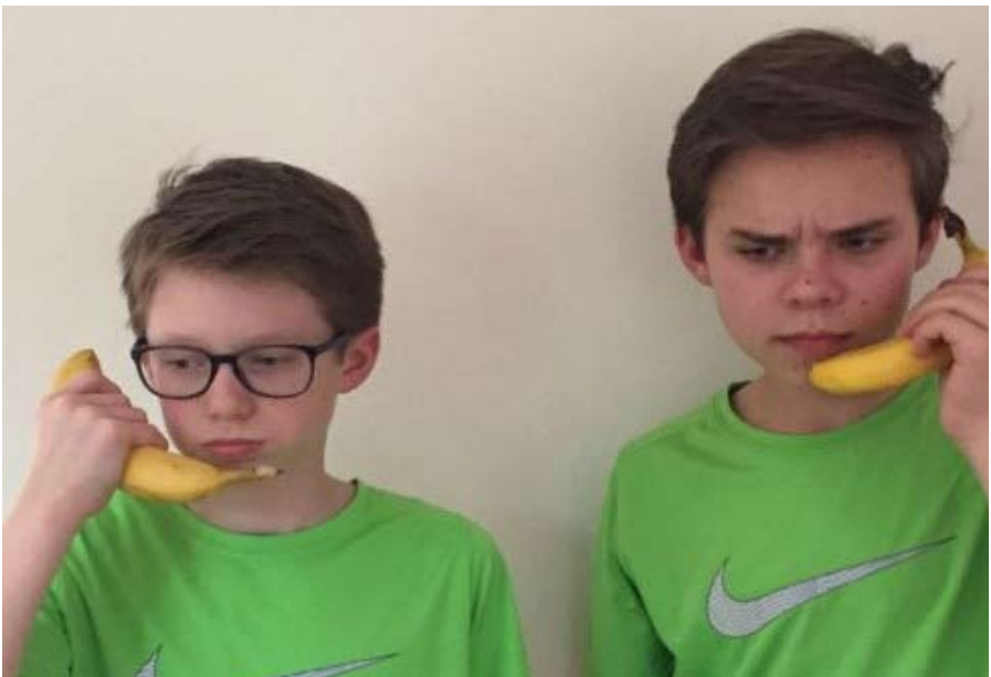
Natürlich telefonieren wir auch mit unseren Managern!