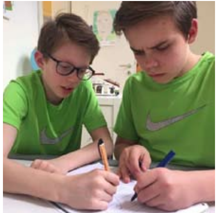
Wir gehen auch schon unsere Taktiken durch.