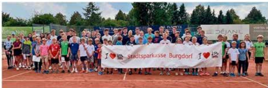
Die Teilnehmer der Jugend-Stadtmeisterschaften im Tennis freuen sich über ein spannendes Turnier.

72 Spieler treten bei den Stadtmeisterschaften um den Sparkassen-Cup an